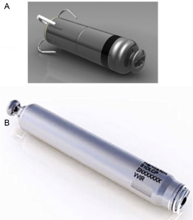
Figura 2. Imagen de los 2 modelos de marcapasos sin cables disponibles. A: Micra ® . B: Nanostim ® .

Actualmente existen 2 modelos de dispositivos monocamerales (Nanostim ® de St. Jude Medical ® y Micra ® de Medtronic ® ) que