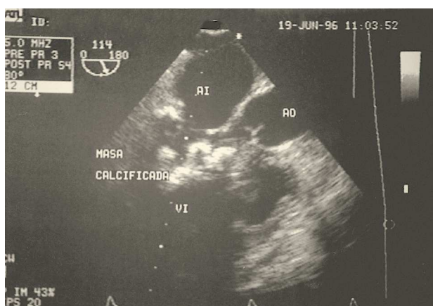
Fig. 1. Ecocardiograma transesofágico: en el ventrículo izquierdo se aprecia masa calcificada que deja sombra acústica.

Las calcificaciones tisulares son una manifestación frecuente del hipoparatiroidismo secundario que con frecuencia presentan los pacientes con insuficiencia renal crónica. Las localizaciones cardíacas habituales son las válvulas (principalmente el anillo mitral), nodos sinusal y auriculoventricular, arterias coronarias y más raramente el endocardio y miocardio ventricular. Este es un caso excepcional de calcificación masiva endomiocárdica con restricción asociada e insuficiencia cardíaca severa refractaria a tratamiento médico.