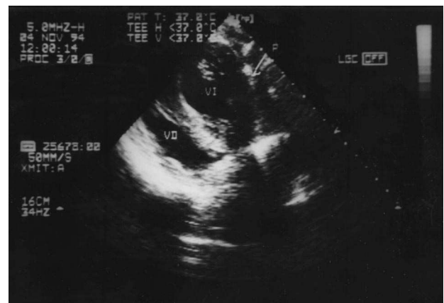
Fig. 3. Ecocardiograma transesofágico intraoperatorio postevacuación (plano transgástrico); P: pericardio; VD: ventrículo derecho; VI: ventrículo izquierdo.

Se intervino en noviembre de 1994 (a los 23 meses de la cirugía de revascularización) con el diagnóstico de hematoma intrapericárdico retrocardíaco, con compresión de cavidades izquierdas e insuficiencia cardíaca grado III. Por toracotomía posterolateral izquierda se realizó evacuación del hematoma, encon-