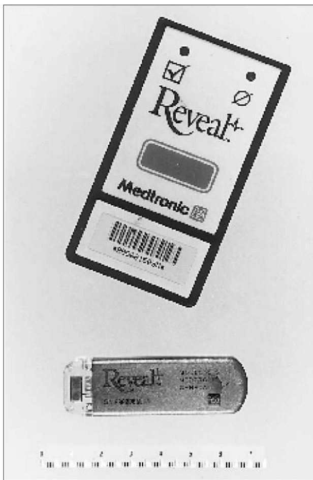
Fig. 1. Componentes del sistema de Holter implantable subcutáneo Medtronic Reveal. En la parte superior, activador externo del sistema. En la parte inferior, registrador implantable.

También se realizó radiografía de columna cervical en la que se observaron alteraciones degenerativas acorde con su edad, Doppler de troncos supraaórticos que evidenció ligera ateromatosis difusa carotídea sin estenosis significativas, gammagrafía ósea que descartó compresión vascular por expansión ósea cervicocefálica secundaria a forma polioestótica del Paget y resonancia nuclear magnética sin hallazgos significativos.