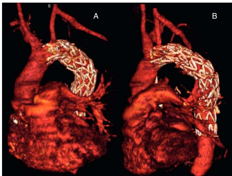
Figura 2. Imágenes postoperatorias. Nótese el bypass carotidosubclavio izquierdo. A: vista frontal. B: vista lateral.

abordaje endovascular 4-6 . Sin embargo, todavía existe controversia acerca de la indicación de antibioterapia a largo plazo 6 .