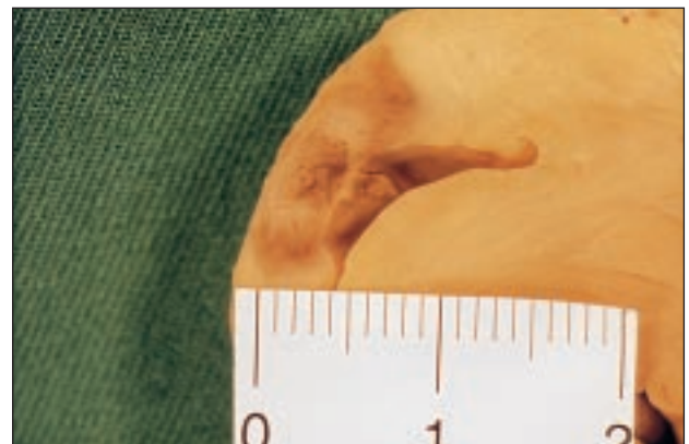
Fig. 3. Lesión producida por un catéter irrigado con 50 W, en una posición similar. La imagen muestra una regla y está realizada con la misma ampliación que el caso de la figura 2. Obsérvese que su diámetro en la superficie es de 1,4 cm, mientras que la anterior oscila alrededor de 0,7 cm. La lesión es completamente transmural, lo que le da un aspecto elipsoidal en vez de esférico.