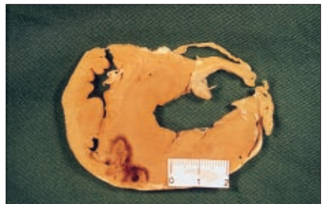
Fig. 4. Lesión producida con un catéter irrigado y 50 W. En esta figura se observan 2 lesiones cercanas en el septo interventricular, producidas desde el ventrículo derecho, como en el caso de la figura 5. Estas lesiones son muy profundas, con una base estrecha y una circunferencia máxima alejada de la superficie endocárdica y un tamaño considerablemente mayor que las de las otras figuras (estándares o irrigados de 15 W).