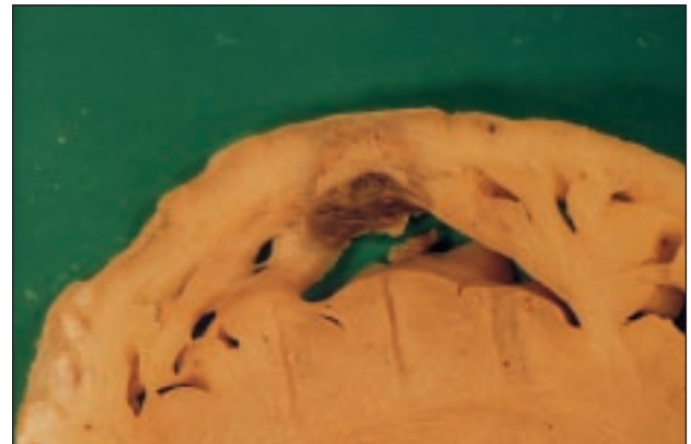
Fig. 2. Lesión producida en la pared lateral del ventrículo derecho con un catéter estándar y con 50 W, que afecta la superficie endocárdica en contacto cercano con la punta del catéter. Se trata de una de las lesiones de mayores dimensiones que obtuvimos con un catéter estándar a máxima potencia.

Con energías de 50 W el tamaño de la lesión fue significativamente más grande para catéteres irrigados que estándar ( 756 \pm 420 \mu\text{l} para el sistema cerrado y 1.788 \pm 1.133 \mu\text{l} para el sistema abierto frente a 146 \pm 110 \mu\text{l} para el estándar; p = 0,0001 ) (fig. 4). Con energías de 25 W, el catéter irrigado produjo igualmente lesiones más grandes que las obtenidas con catéter estándar a 50 W. Sin embargo, a 15 W las lesiones producidas con catéteres irrigados no fueron significativamente mayores que las producidas con los estándares (figs. 5 y 6) ( 270 \pm 261 \mu\text{l} para el sistema cerrado, 153 \pm 144 \mu\text{l} para el sistema abierto y 146 \pm 110 \mu\text{l} con estándares; p = \text{NS} ). El tiempo de aplicación tuvo también una influencia importante en el tamaño de las lesiones. Para los catéteres estándar, la diferencia en el tamaño de las lesiones producidas con aplicaciones < 30 \text{ s} ( 85 \pm 57 \mu\text{l} ) y aquellas > 30 \text{ s} ( 208 \pm 118 \mu\text{l} ) fue estadísticamente significativa. Hallazgos similares se observaron con las lesiones producidas con catéteres