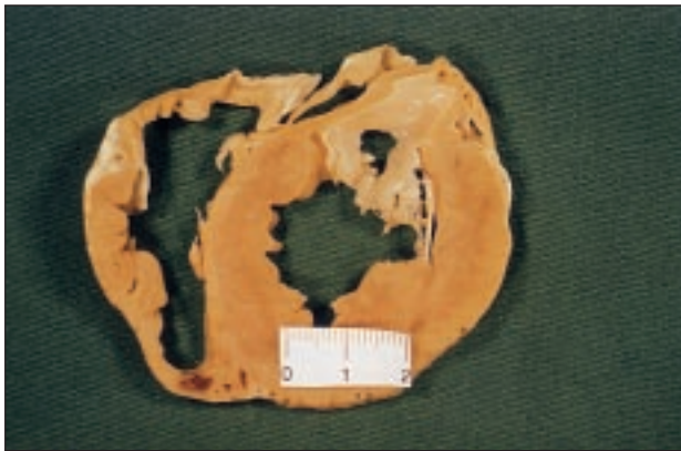
Fig. 5. Lesión producida con un catéter irrigado y 15 W. Se observa cómo el tamaño conseguido con esta energía es similar al producido con un catéter estándar y energía de 50 W.