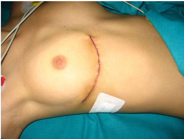
Figura 1. Incisión submamaria derecha.

dorsal ancho y el serrato. Al tórax se accede a través del cuarto espacio intercostal. Tras reseca el lóbulo derecho del timo, el pericardio se abre por delante del frénico y se prolonga la incisión cranealmente por encima de la aorta y caudalmente hasta el diafragma. La exposición de la aorta se facilita mediante la fijación del pericardio a la segunda costilla pasando una cinta que permita traccionarla y manipularla.